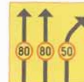
Ajokaistakohtainen kielto tai rajoitus